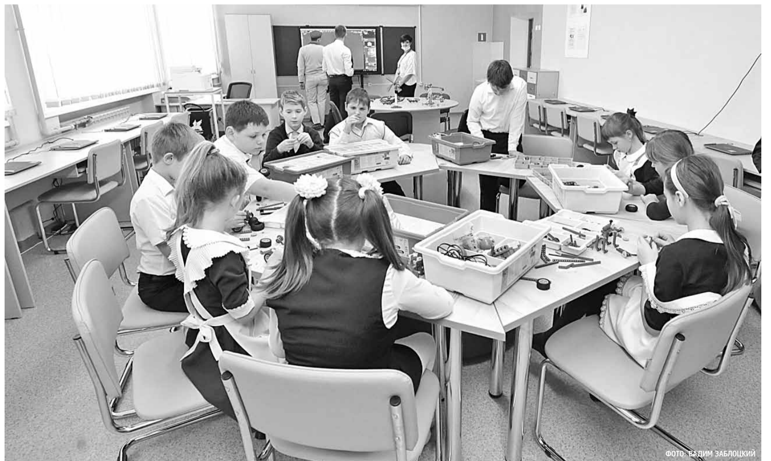
В «Точке роста» Алексеевской школы Корочанского района